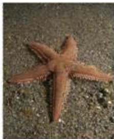
図 2. TTX 保有ヒトデ トゲモミジガイ Astropecten polyacanthus .