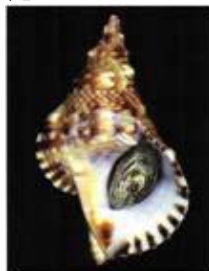
図 1. TTX 保有巻貝 ボウシュウボラ Charonia sauliae .

それでは、フグに摂取された TTX はどんな働きをしているのだろうか。これに関連して、当研究室では現在「フグ腸内の TTX が、フグ腸内細菌の代謝を変化させ未知の代謝産物を産生させている」との結果を得つつある。本研究についても紹介したい。