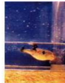
図 3. TTX 含有ゼラチンに誘引され、これをつつくトラフグ Takifugu rubripes .